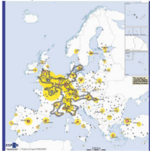
Abbildung 2 – Lissabon-Szenario 2030

gend Erfahrungen gesammelt, um das Optimum aus einem Public-Private-Partnership heraus zu ziehen? (OECD 2006)